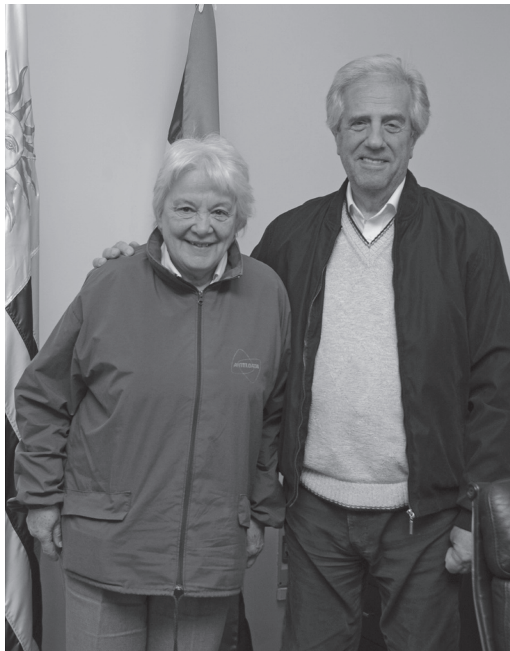
El Presidente Tabaré Vázquez y la flamante Vicepresidenta Lucía Topolansky en la residencia de Suárez, al asumir la Senadora la presidencia de la República en forma interina, por el viaje de Vázquez a las Naciones Unidas.

R: Creo que nada en particular, salvo sus ideas para quienes no gustan de ellas